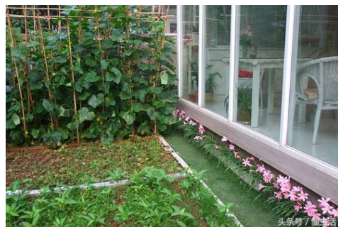
北京郊区民居菜园