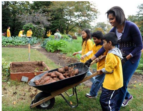
米歇尔·奥巴马夫人在白宫种植的菜园

业委员会执行副主任，原《自然辩证法研究》编辑部主任、编审，当选美国休闲科学院 2006 年院士，国际社会休闲社会学委员会执委。著有：《于光远马惠娣十年对话：关于休闲研究的十个基本问题》、《自由与审美：休闲的两只翅膀》；组织翻译“西方休闲研究译丛”、“中国学者休闲研究丛书”等。“自产食蔬”国际合作项目中方主持人。学术研究领域：自然辩证法，跨学科休闲研究。