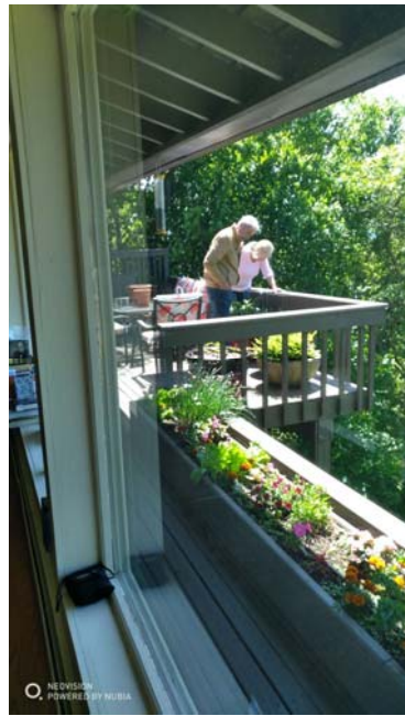
美国人阳台种植的菜蔬与鲜花